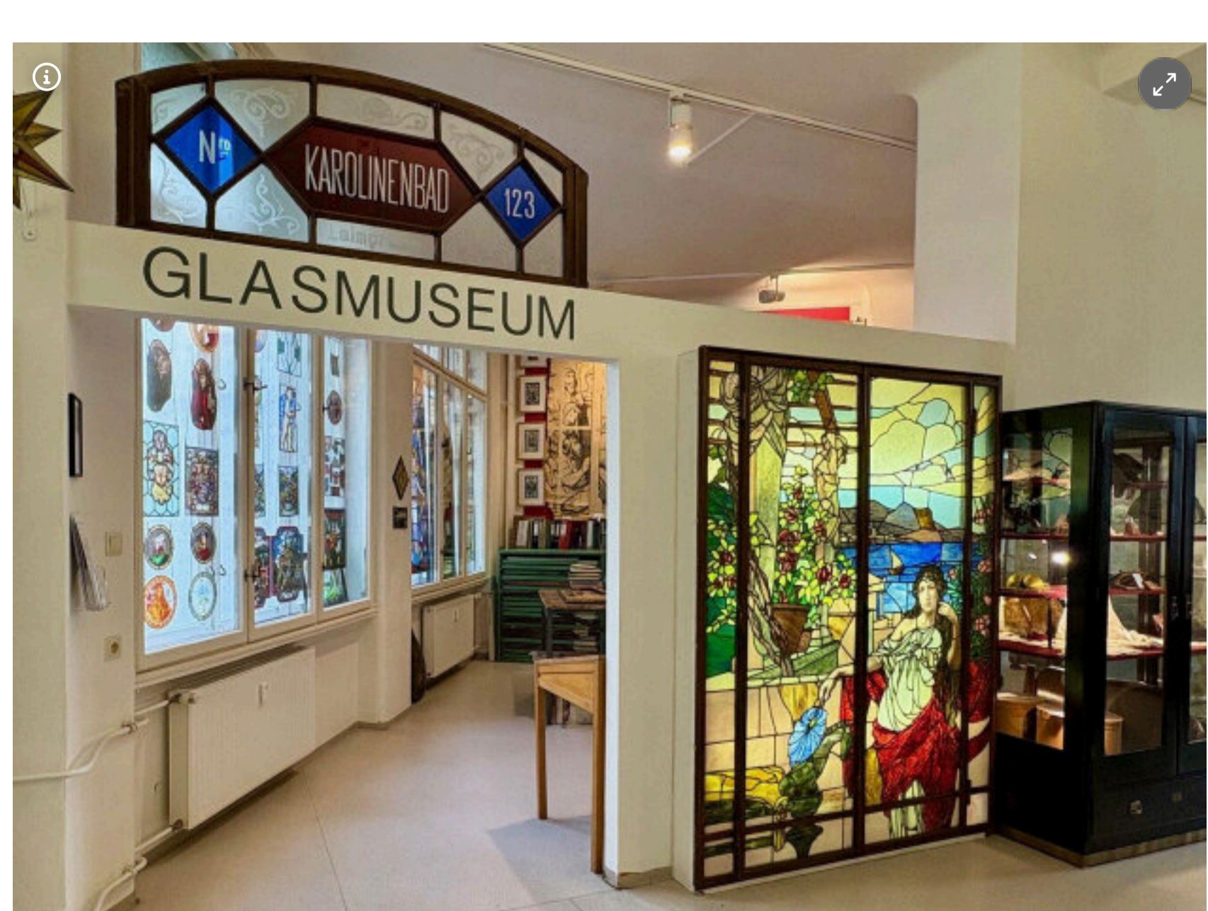
Das Glasmuseum beherbergt eine österreichweit einzigartige Sammlung zur Technik der Glasmalerei und ihrer kunsthistorischen Bedeutung.

Weiterlesen: Wer das Glück bringt: Zu Besuch im Wiener Rauchfangkehrermuseum