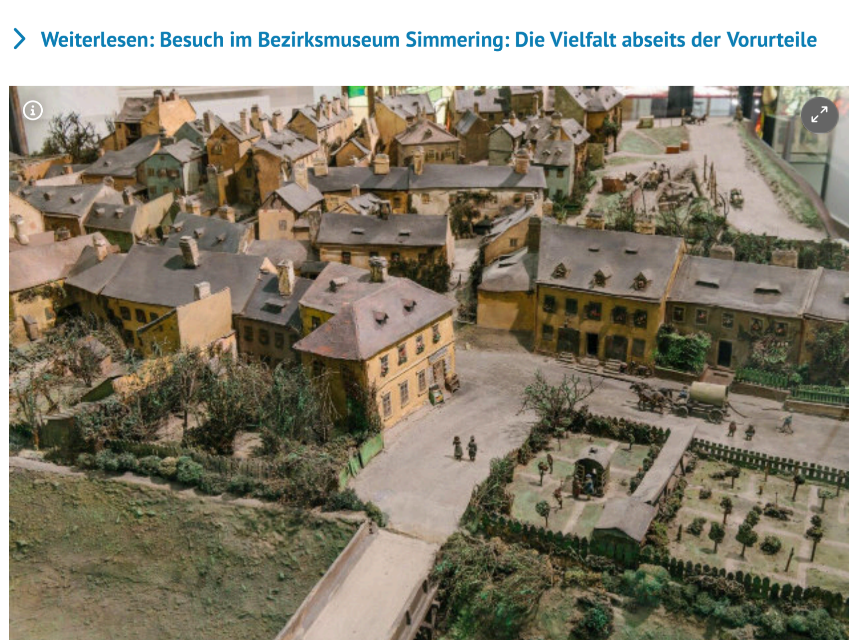
Das historische Modell des Ratzenstadels ist neun Quadratmeter groß.

Weiterlesen: Besuch im Bezirksmuseum Simmering: Die Vielfalt abseits der Vorurteile